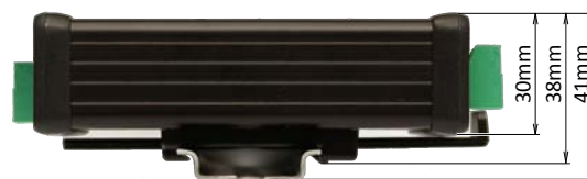
Pohľad z boku s pripevnenou DIN lištou